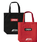
トートバッグ (2種類) 4,400円