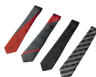
ネクタイ (4種類) 10,000円