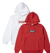
パーカー (2種類/M・L・XL) 9,000円