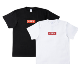
Tシャツ (2種類/M・L・XL) 5,000円