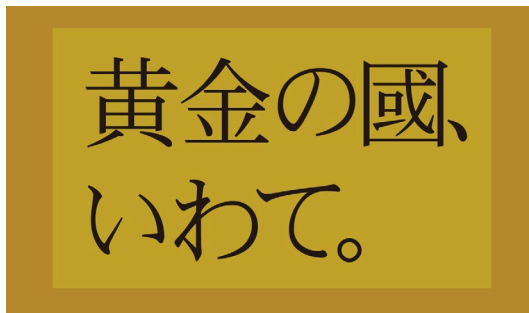
ヘッドレストカバー (前面)