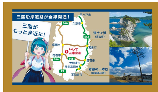
ヘッドレストカバー (後面)