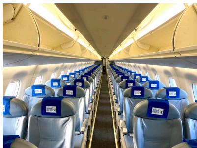
機内の様子 (前方から)