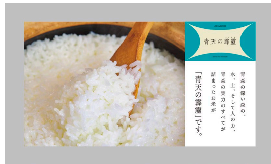
ヘッドレストカバー (後面)