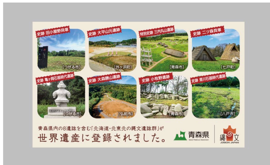
ヘッドレストカバー (前面)