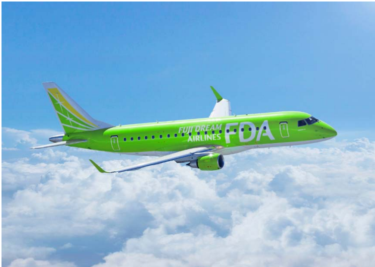
8号機イメージ画像

FDA 創業の地でもある“静岡”の緑茶をイメージさせる鮮やかな『ティーグリーン』をまとい、レジストレーション番号‘JA08FJ’が与えられる8号機は、2014年3月よりFDAのフリートに加わる予定です。