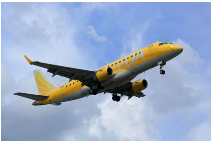
7号機イメージ画像