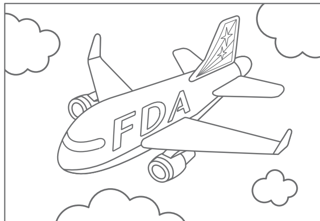
幼児-低学年の部用 塗り絵 : 幼児から小学校2年生まで

ご応募の中から最優秀作品には、ご家族でご搭乗いただける往復航空券をプレゼント。また、優秀作品には、FDAのタミヤ製エアプレーンモデルをプレゼントいたします。